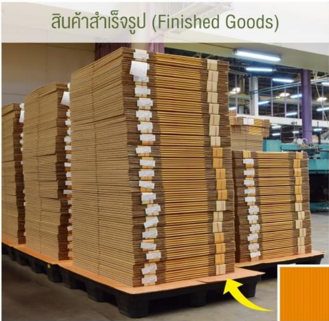
สินค้าสำเร็จรูป (Finished Goods)