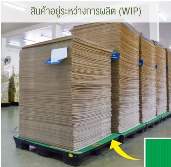
สินค้าอยู่ระหว่างการผลิต (WIP)

รองพื้นด้วยแผ่นพลาสติกพีวีเอเจอร์บอร์ดขนาดพอดีกับพาเลท ไม่ให้สินค้าสัมผัสกับพื้นพาเลทโดยตรง ช่วยป้องกันสิ่งปลอมปนต่างๆ ทั้งยังช่วยรักษาสถานะของผลิตภัณฑ์ไปพร้อมกัน